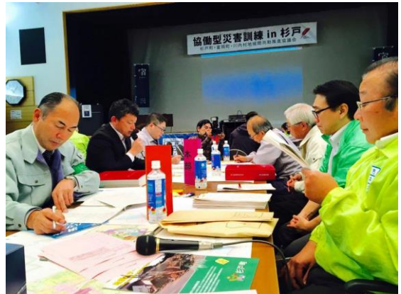
▲ICS リーダー研修の様子

確にし、災害に対応するシステムである。その組織の5つの主要な機能は、指揮（Command）、実行（Operation）、計画（Planning）、後方支援（Logistics）、財務総務（Finance）から構成され、一元的な情報収集と指揮命令を行う現場指揮所を置くことで、近隣から参集した人材を組織化するのにも有効であり、グローバルスタンダードに使用されている。